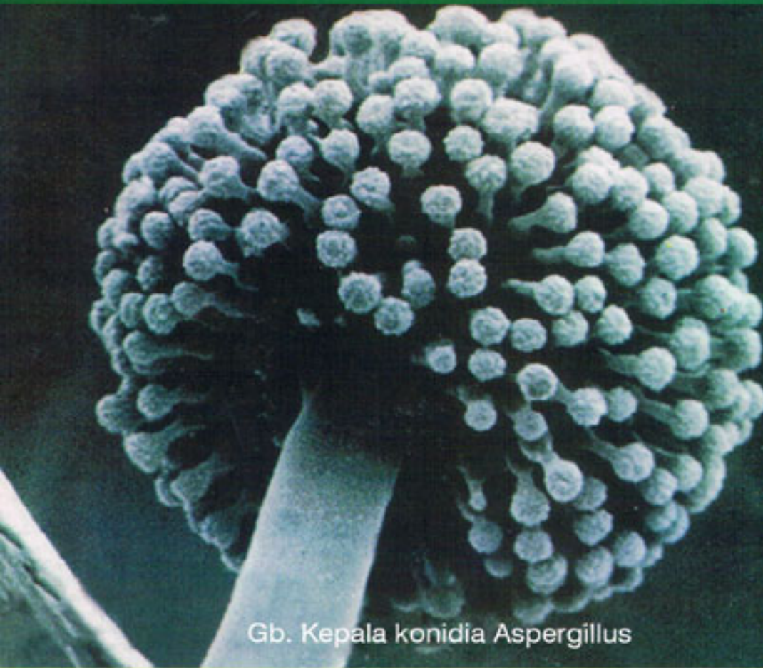
Gb. Kepala konidia Aspergillus